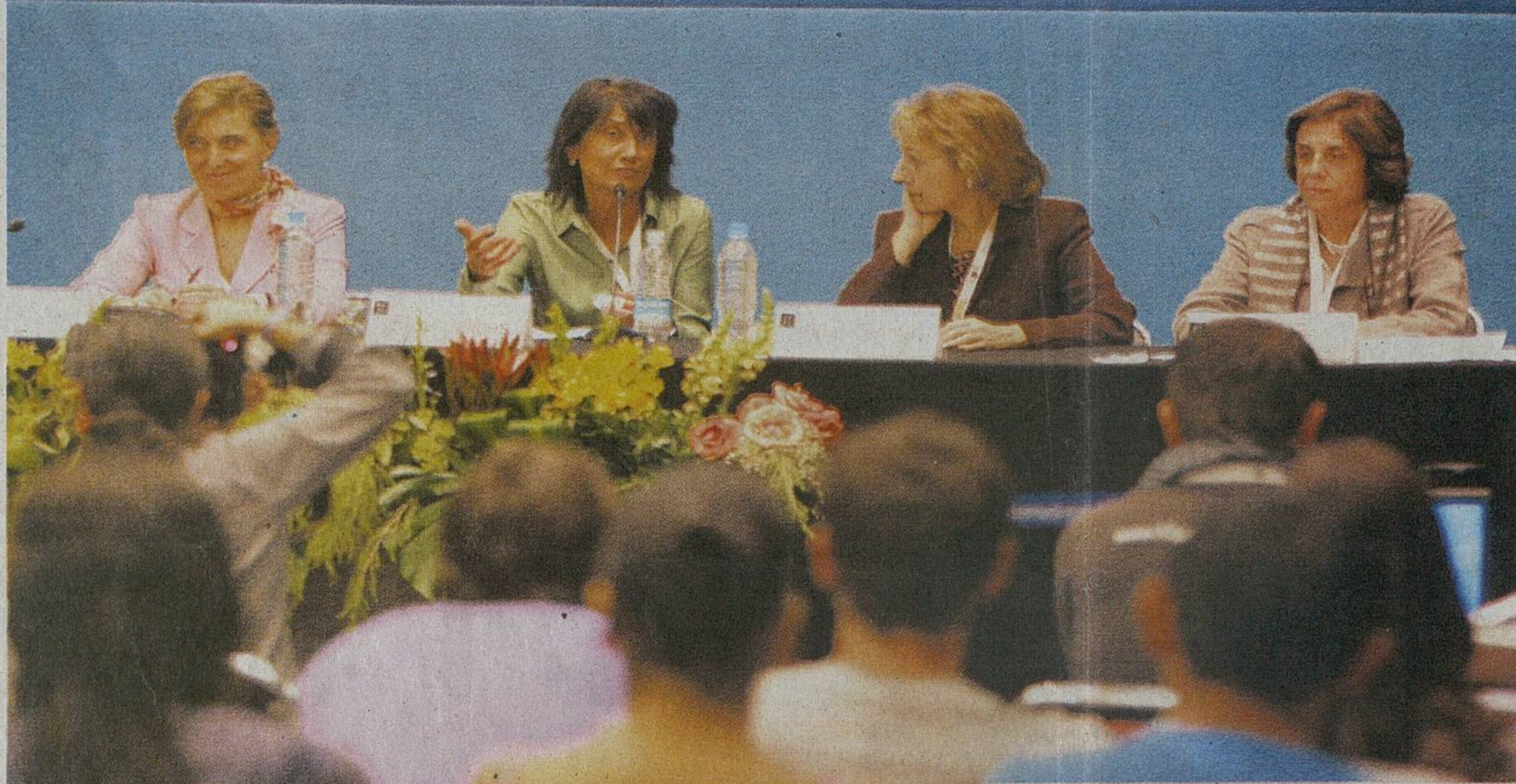
EL INFORMADOR • E. BARRERA

• Amigos y familiares del Premio Cervantes 1993 participaron en La realidad narrada: el compromiso ético y social de Miguel Delibes .