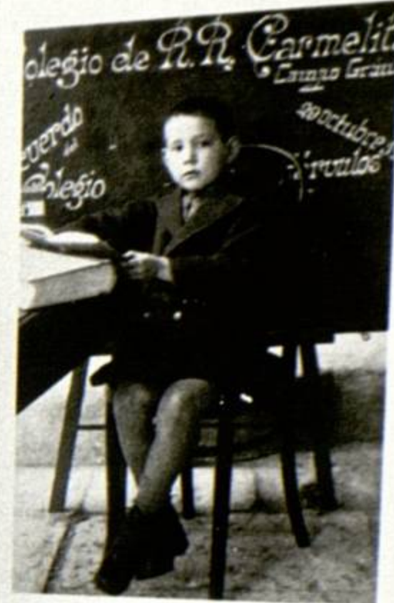
Parvulo en el Colegio de las Carmelitas, 1926