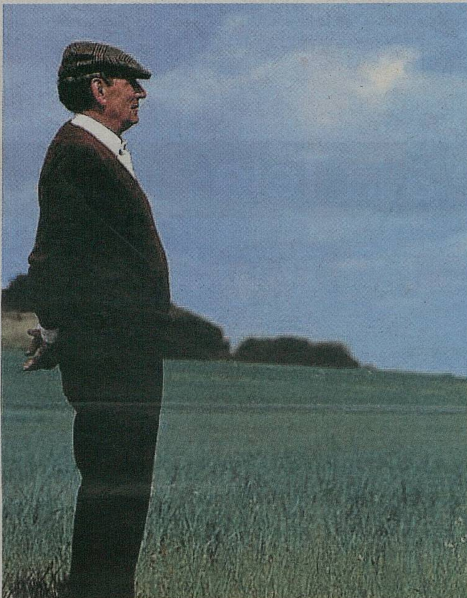
La mirada de Delibes se pierde en la llanura.

El volumen se divide en cuatro bloques: 'Mi ciudad, mi provincia, mi gente', 'Semblanzas', 'Recuerdos y nostalgias' y 'Narraciones'. El primer apartado se nutre de testimonios que hablan directamente de Valladolid y su provincia; son textos espigados de artículos de prensa, discursos y guiones de documentales televisivos. «Sencillamente, estoy aquí -dijo Delibes cuando le concedieron en 1986 el título de Hijo Predilecto de su ciudad natal- porque no me hubiera acertado a estar en otra parte, porque sin este cepellón bajo mis pies me hubieran faltado nutrientes y