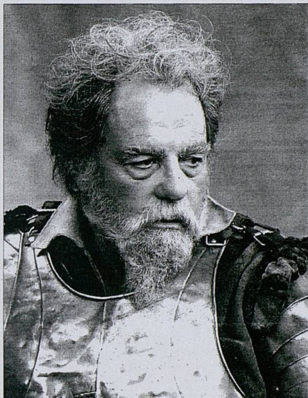
Juan Luis Galiardo es Don Quijote en la película de Gutiérrez Aragón.