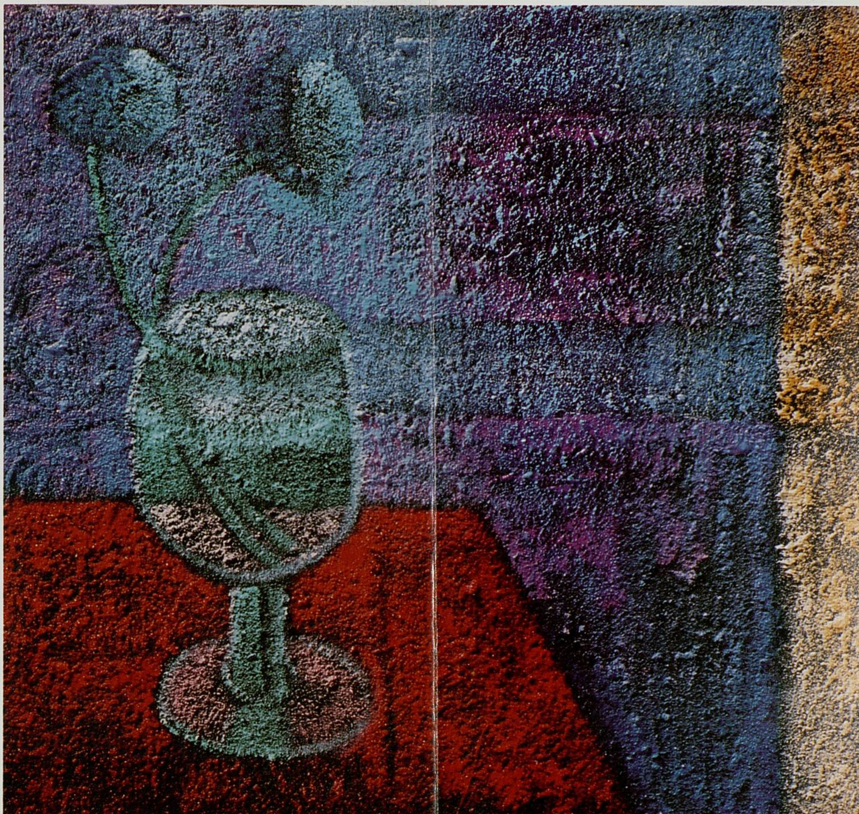
"Dos flores silvestres". Técnica mixta. 35 x 35 cm.