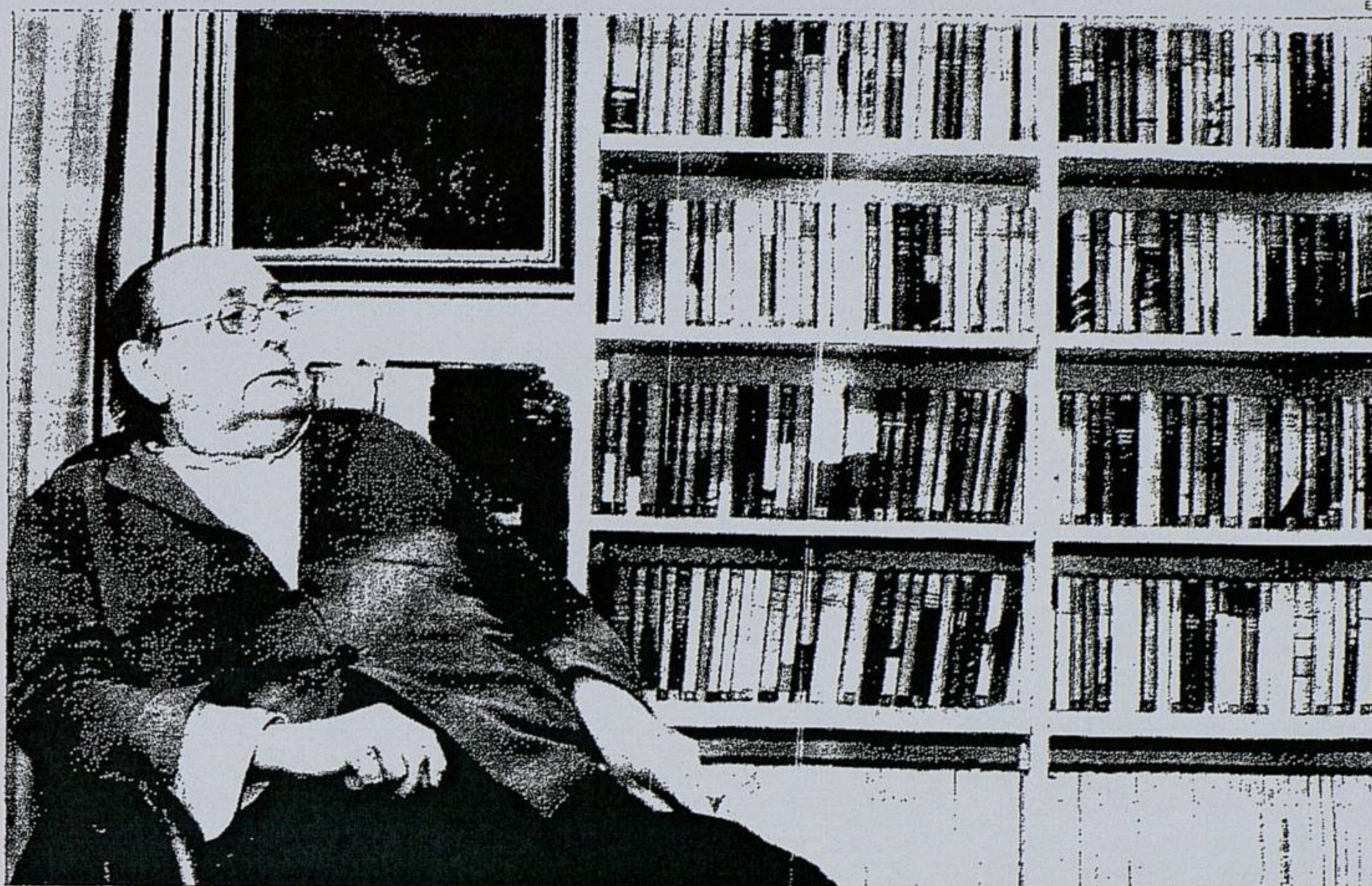
El novelista posa en su casa de Valladolid con la biblioteca al fondo