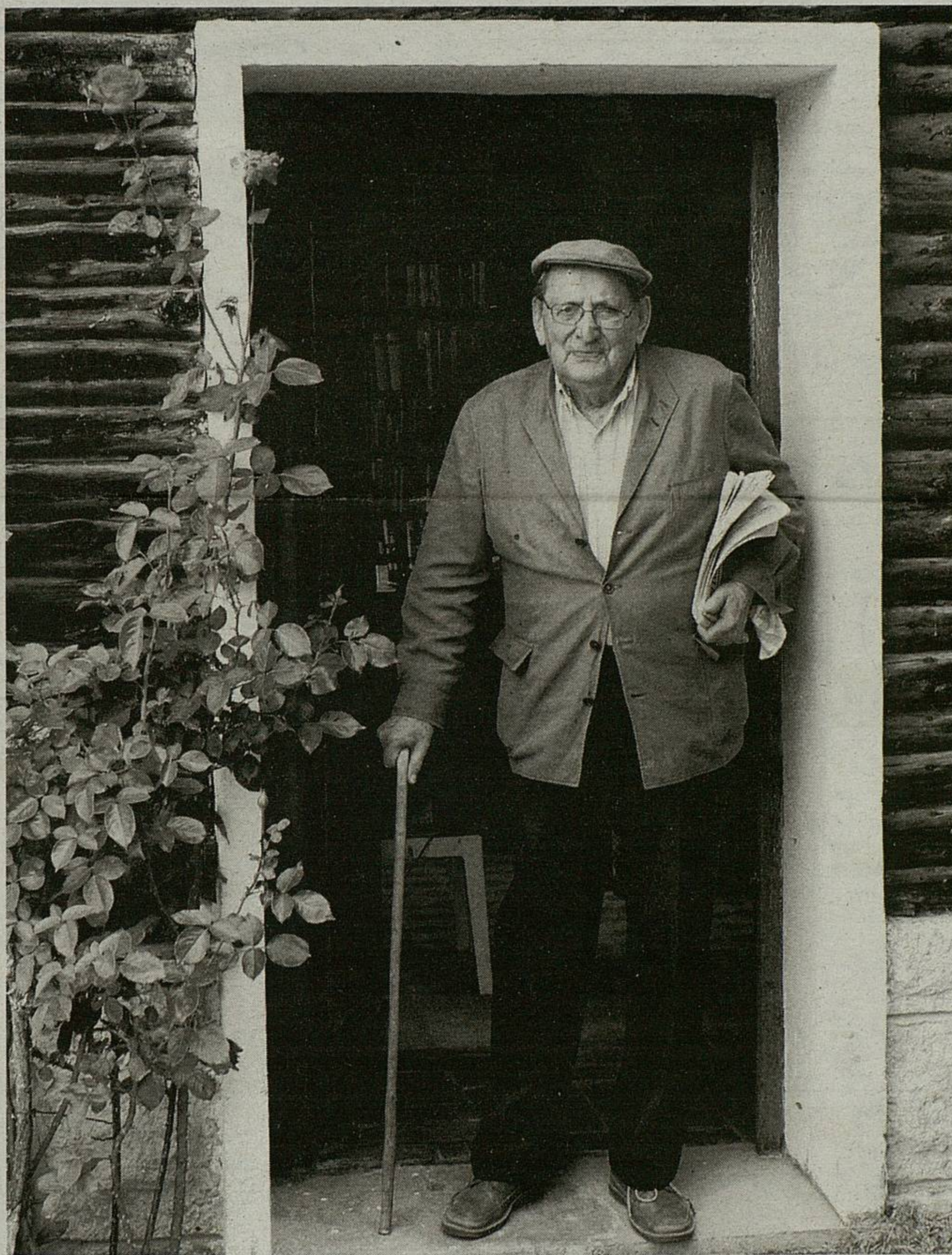
Miguel Delibes, en su «refugio» literario en la localidad burgalesa de Sedano

Delibes se ha pasado más de seis décadas siguiendo el rastro de las palabras y expresiones ajenas, para intentar encontrar las suyas propias: «Y a estas alturas —dijo en el Congreso de la Lengua de Vallado-