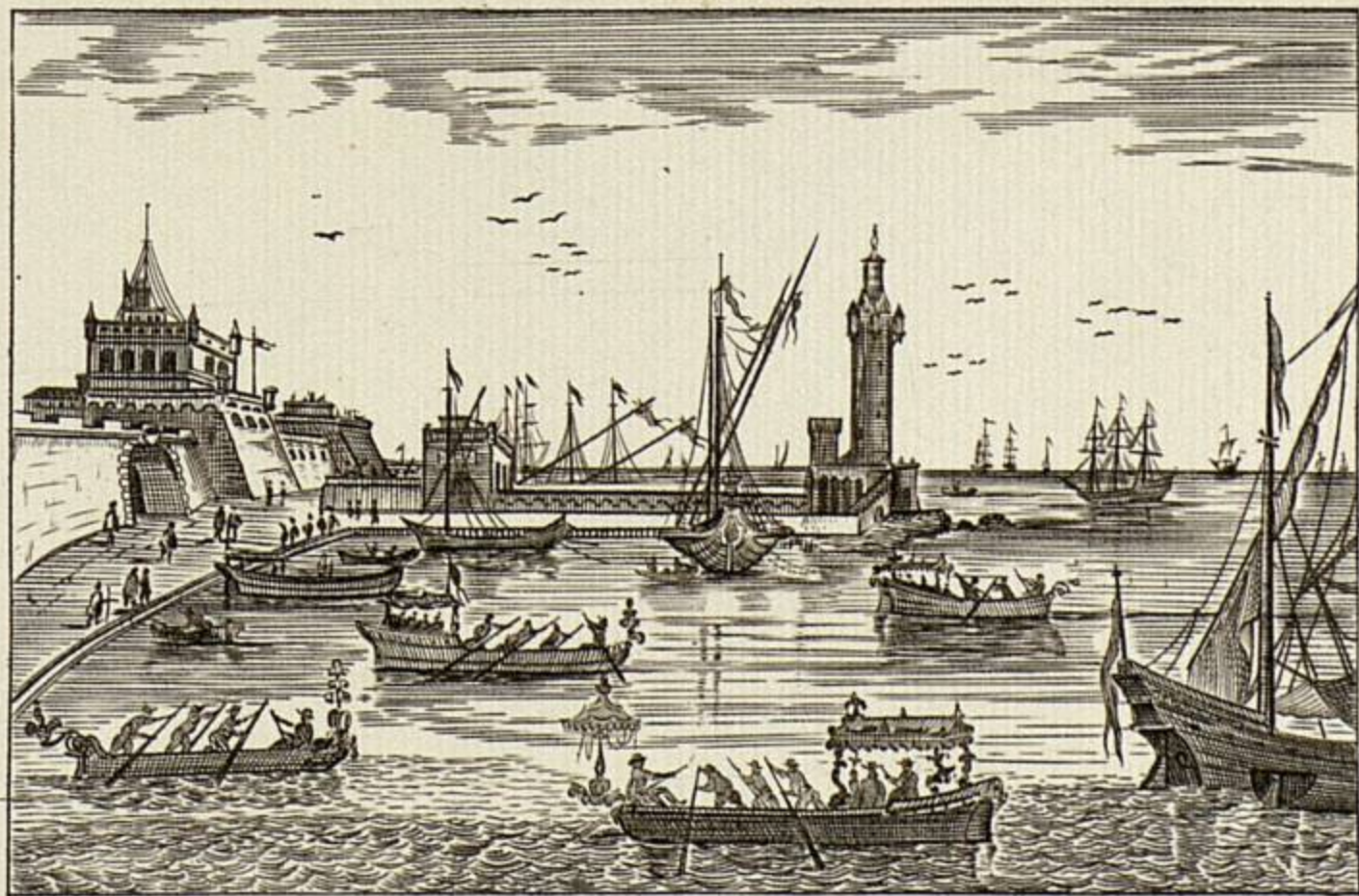
Napoli - Veduta del Castelnuovo e del Molo