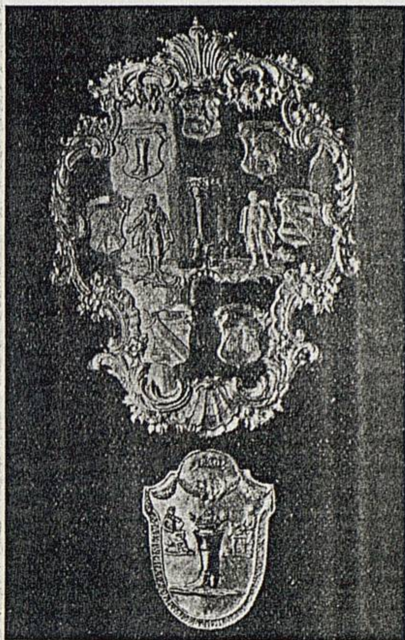
Escudo del Gremio de zapateros de Brujas (siglo XVIII)

Las Cortes de Toro, Burgos, Valladolid, Aragón, Cataluña, etc., contienen gran número de disposiciones encaminadas á reglamentar la industria. El Ordenamiento de Menestrales de Pedro el Cruel de 1351 es sin duda el prototipo, como dice Uña Sarthou, de la legislación contemporánea.