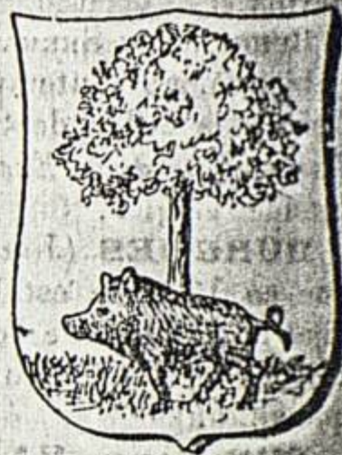
Escudo de Burguete (Navarra)

BURGUETE (RICARDO). Biog. Coronel del ejército español, n. en Zaragoza en 3 de Febrero de 1871. Ingresó en la Academia General en 1885; hizo sus primeras armas en la campaña de Melilla del 1893; tomó parte en la guerra de Cuba, cayendo herido en la acción de Managüeco, donde, mandando una sección de tiradores, atacado y envuelto por infantería y caballería enemiga, se batió con tal denuedo que, por su heroico comportamiento, alcanzó el empleo de capitán y la cruz laureada de San Fernando. En Filipinas recibió un balazo que le atravesó el muslo, obteniendo por sus distinguidos méritos el ascenso á comandante, en cuyo empleo ha permanecido doce años, hasta su ascenso por antigüedad á teniente coronel. Durante este período ha hecho meritisima labor como publicista militar en el libro y en las revistas técnicas nacionales y extranjeras, siendo autor de un proyecto de nueva táctica, del que habló con elogio toda la prensa profesional del extranjero; precursor de las innovaciones, que más tarde ha aceptado