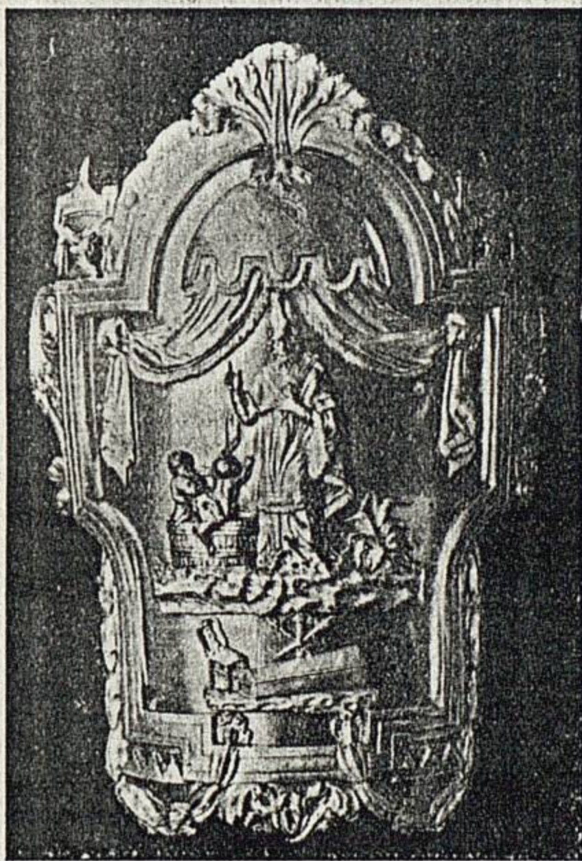
Escudo del Gremio de silleros, torneros, etc., de Brujas (siglo XVIII)

La agremiación actual no ofrece, por tanto, el carácter de los antiguos gremios, ya que ó bien responde á la agrupación de comerciantes para el reparto de tributos y defensa de intereses de clase, ó á las nuevas formas de asociación obrera conocida con el nombre de Sindicatos (V. SINDICATO Y TRIBUTACIÓN). Por otra parte, el desarrollo general de la previsión, en sus as-