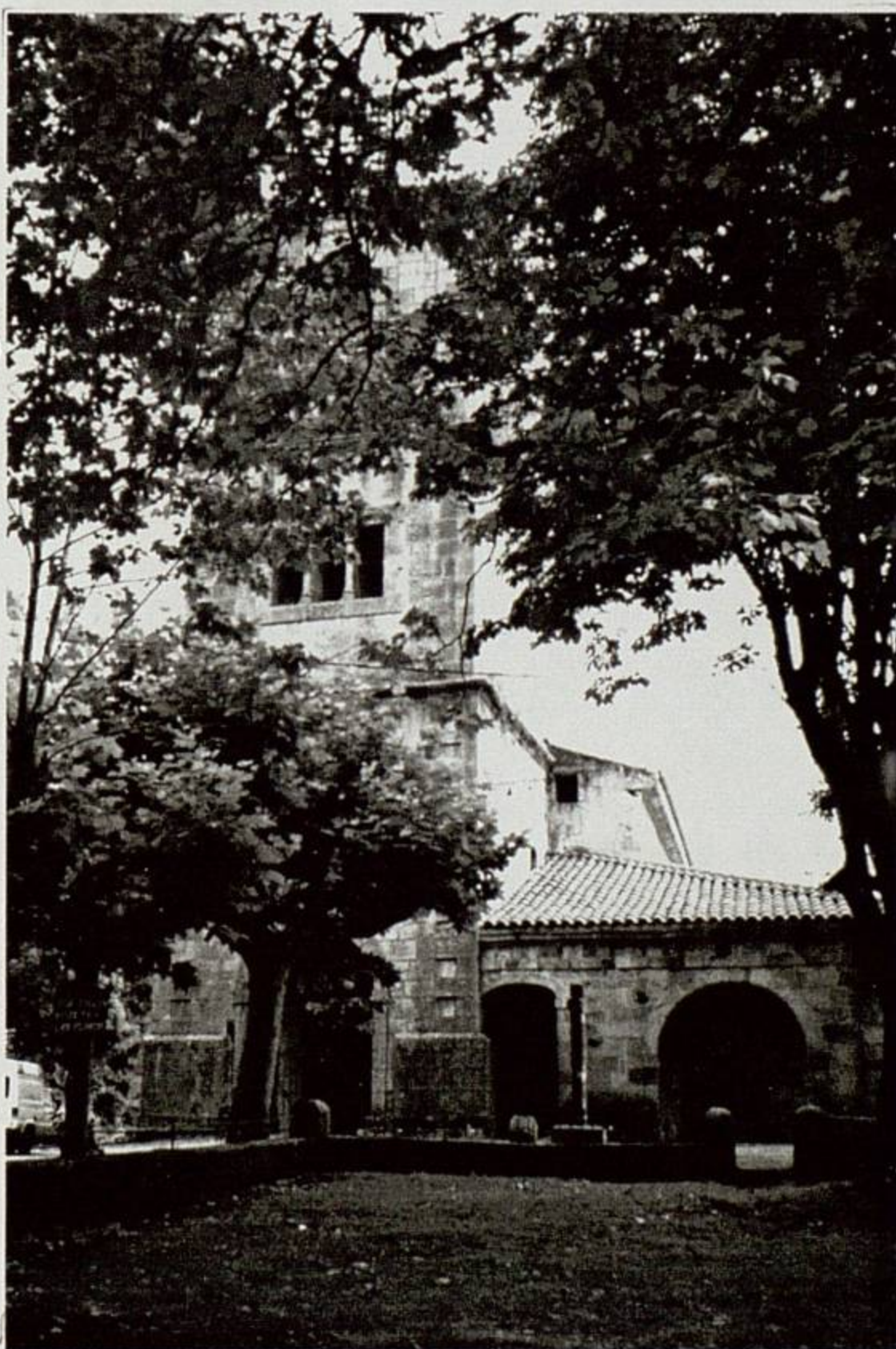
UDALLA Parroquia de Santa María