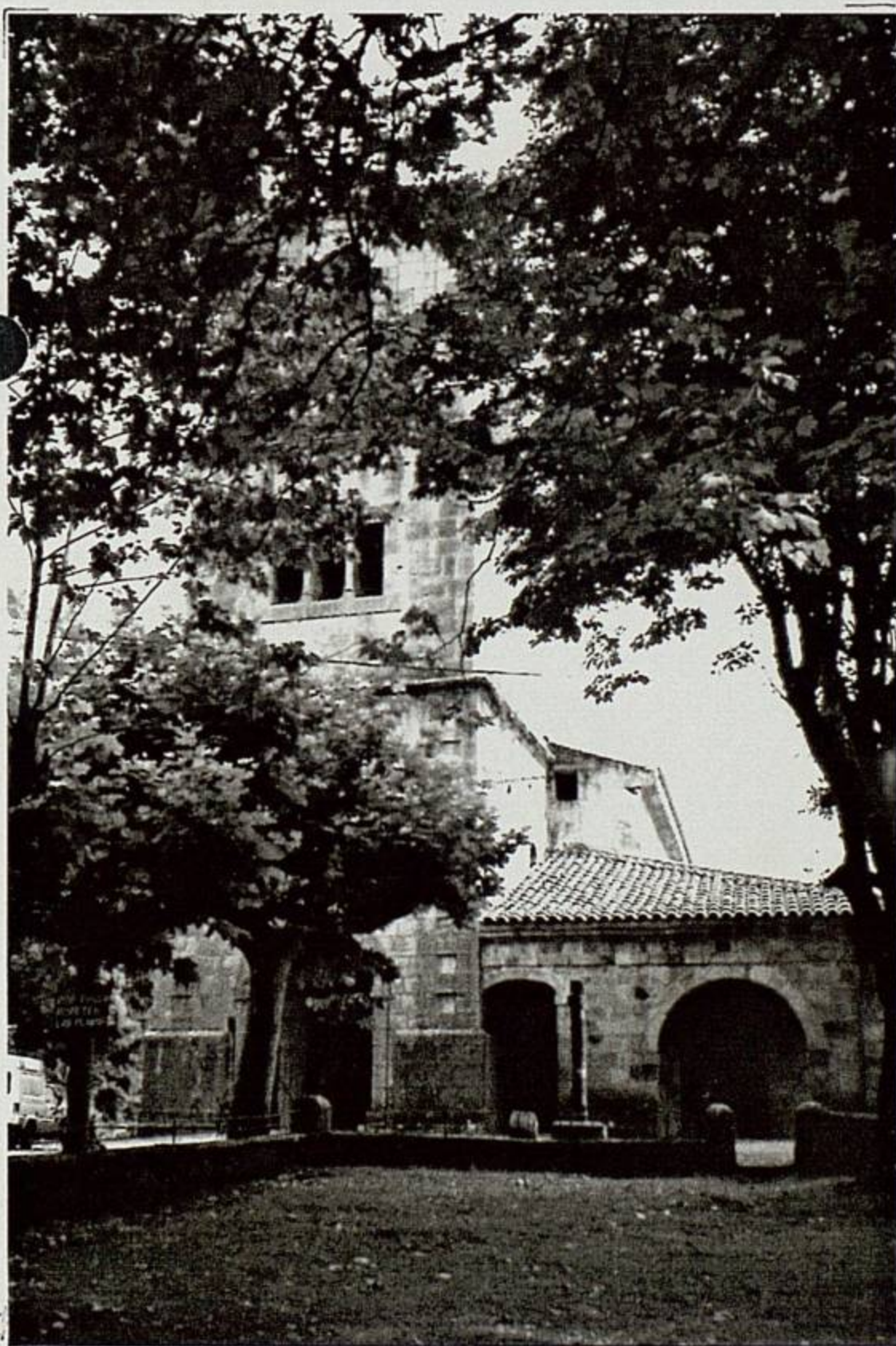
UDALLA Parroquia de Santa María

13 HOZ DE MARRON Parroquia de San Pedro 22