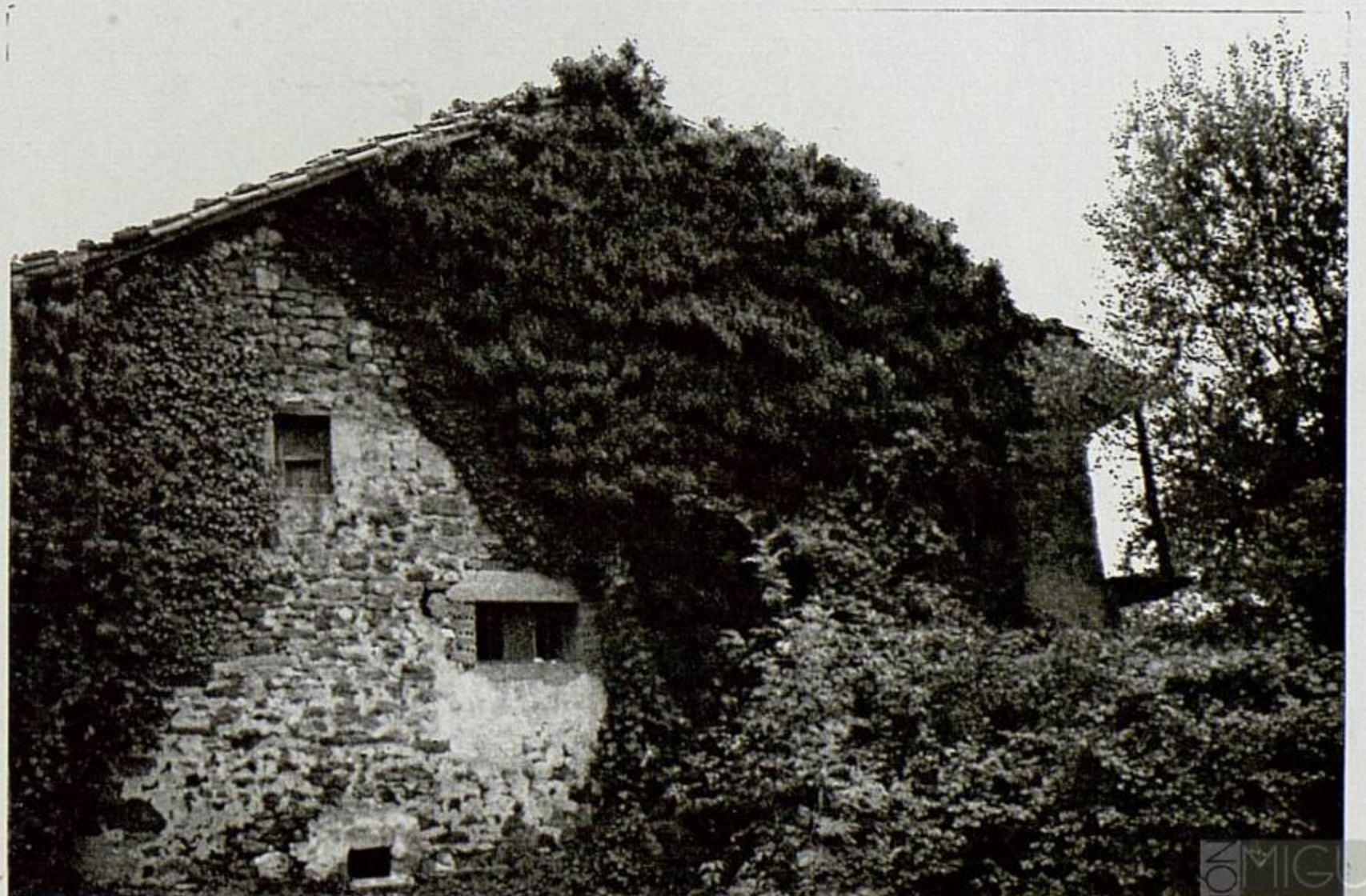
HOZ DE MARRON. LA CUEVA Lo que pudo ser el solar SEPTIEN