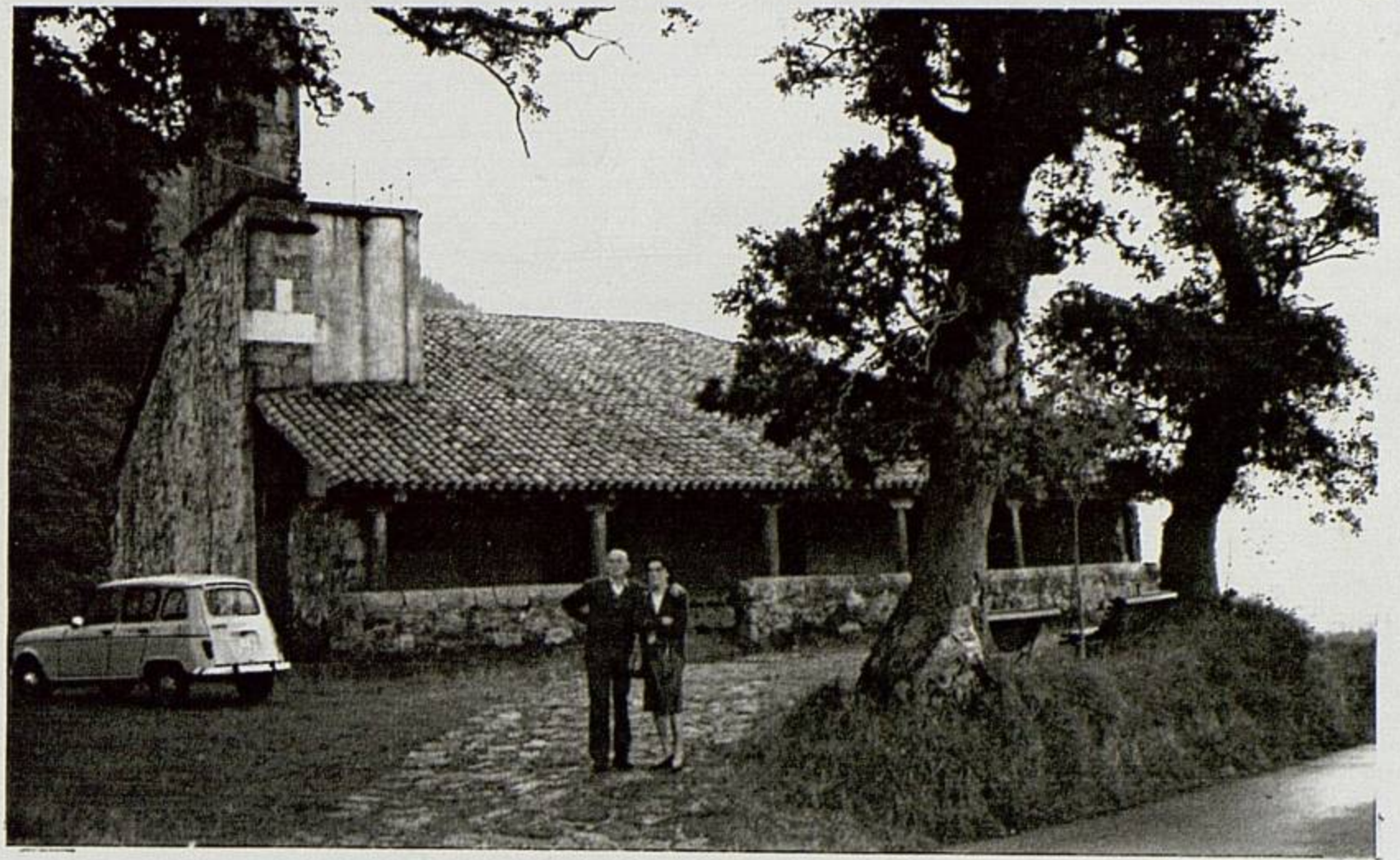
HOZ DE MARRON Parroquia de San Pedro

13 HOZ DE MARRON Parroquia de San Pedro 22