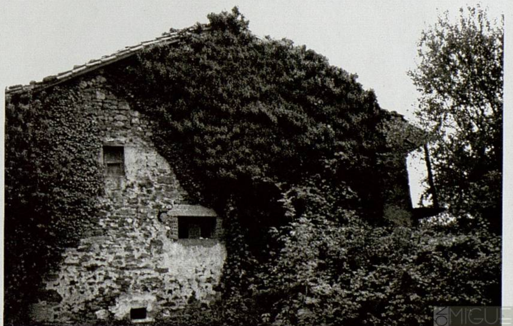
HOZ DE MARRON. LA CUEVA