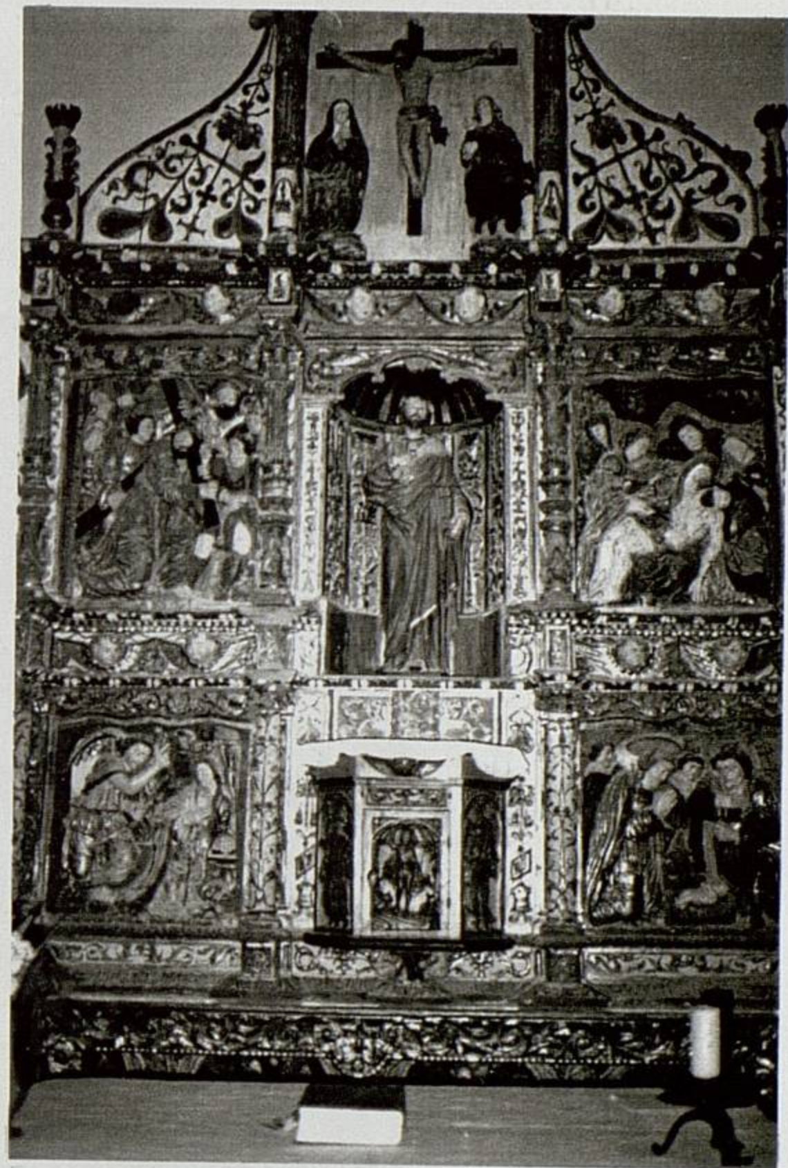
HOZ DE MARRON Parroquia de San Pedro