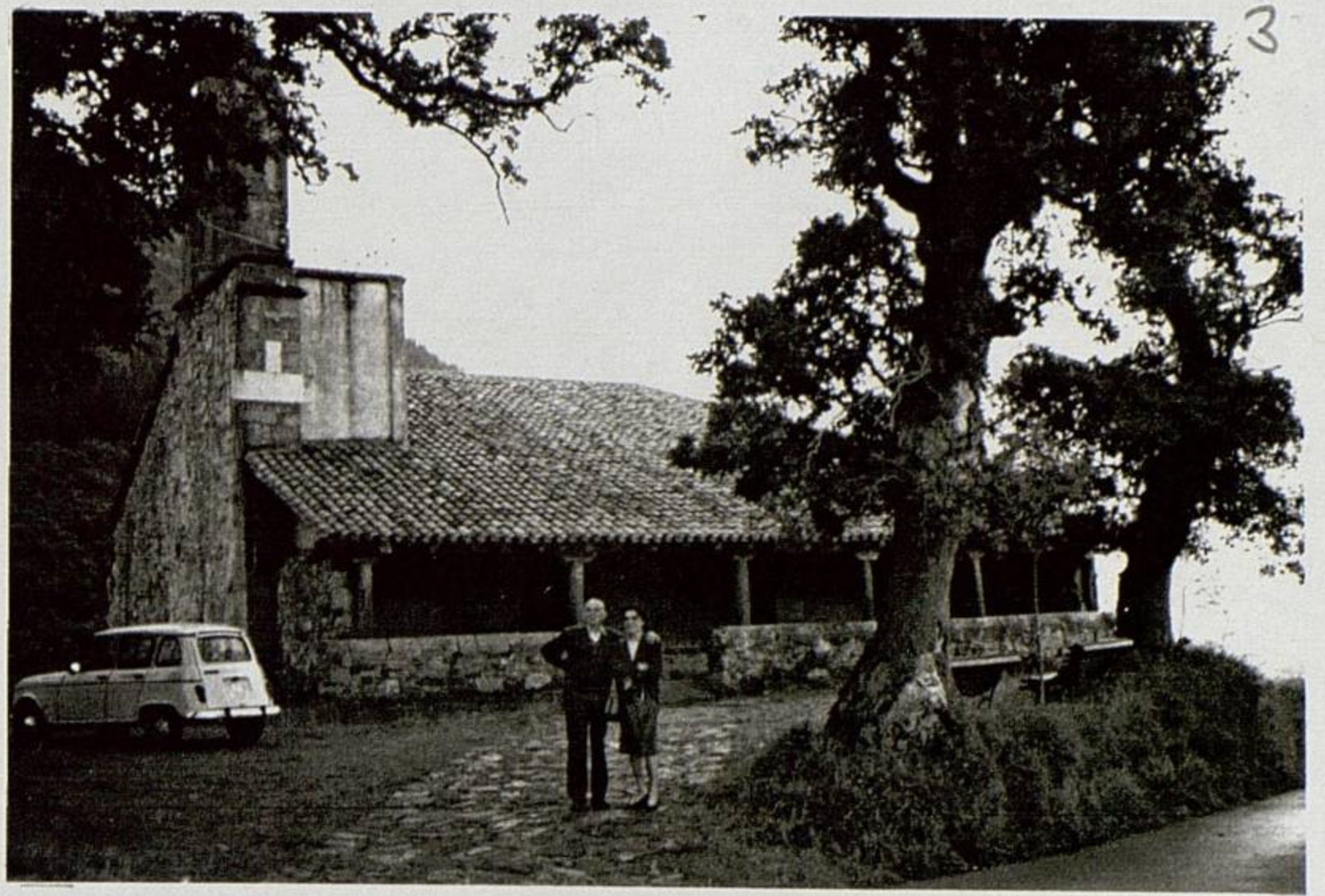
HOZ DE MARRON Parroquia de San Pedro